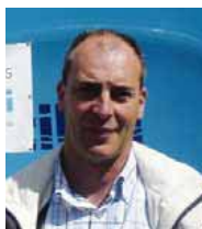
UR BI PISCINAS Mikel Adarraga

Impresión digital en grandes formatos, rotulación de vehículos, tintado de lunas y gigantografía (pantallas gigantes) gracias a una impresora capaz de imprimir hasta 3 metros de ancho en diferentes materiales.