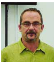
NAVATRES S.L. Luis Carmona

Más información: www.construirnavarra.com