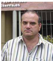
PUBLICAR Carlos Alcin

Nuestra novedad es introducir los perfiles de PVC de la marca Suco. También traemos ventanas de 5-8 cámaras y sistemas de carpintería que cumplen los estándares para el Código Técnico.