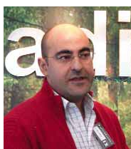
TERRADISA Francisco Romeo

Puertas seccionales de garaje, en imitaciones de madera y colores a elegir. También tenemos puertas de lona, puertas rápidas para industrias, garajes de coche y correderas de cristal.