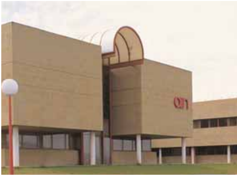
Instalaciones de la Asociación de Industria Navarra en Cordovilla.