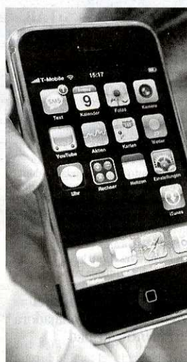
El iPhone, de Apple.

La compañía presidida por César Alierta tiene previsto ofrecer la versión 3G del dispositivo, que combina las características del reproductor de música de Apple iPod con las de un teléfono móvil. Según informaba ayer el citado medio de comunicación, Apple, además de reducir el precio en Europa hasta los 100 euros, ha optado asimismo por un sistema de financiación subvencionada. Esto supondrá asumir un contrato de permanencia que podría prolongarse hasta los dos años. Esto permitirá ofrecer este móvil a un precio de entre 80 y 100 euros a partir de julio. Debido a las elevadas expectativas de venta, Movistar creará una lista de espera a través de su página web donde sus clientes podrán inscribirse a partir de este mes.