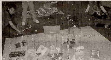
Mapas con objetos cotidianos como la tele o una pecera.

La segunda parte se compondrá de piezas más breves.