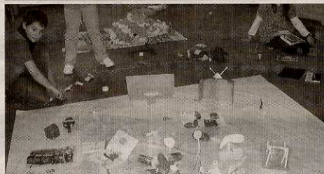
Mapas con objetos cotidianos como la tele o una pecera.

La segunda parte se compondrá de piezas más breves.