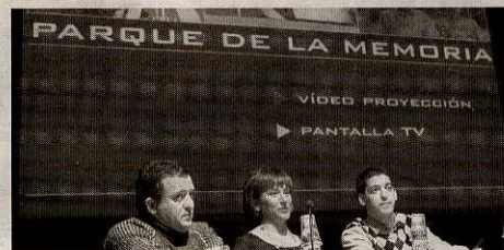
Presentación del Parque de la Memoria.