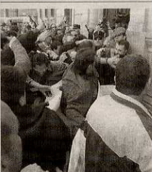
Los hechos, en 2006.