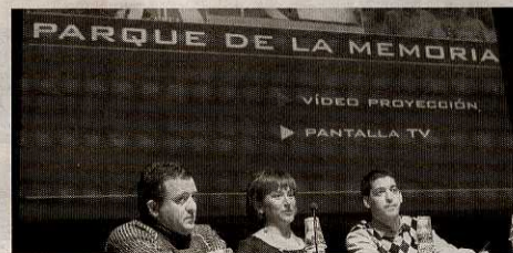
Presentación del Parque de la Memoria.