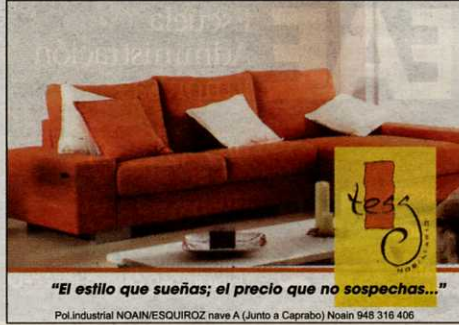
"El estilo que sueñas; el precio que no sospechas..."

mantendría su suministro hasta 2009, propuesta aceptada por los delegados de UGT y CCOO. Los representantes de ELA y LAB en el comité, así como trabajadores de todos los grupos, no aceptaron. "Queremos que nos aseguren el trabajo después de esa fecha".