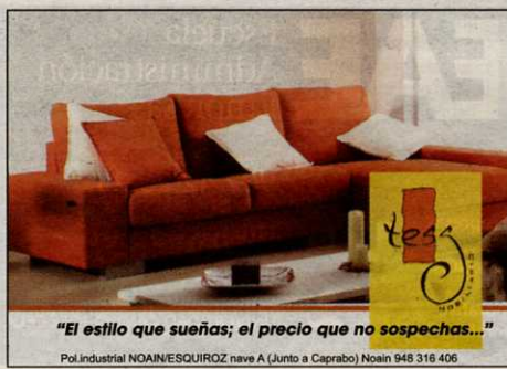
"El estilo que sueñas; el precio que no sospechas..."

mantendría su suministro hasta 2009, propuesta aceptada por los delegados de UGT y CCOO. Los representantes de ELA y LAB en el comité, así como trabajadores de todos los grupos, no aceptaron. "Queremos que nos aseguren el trabajo después de esa fecha".