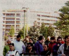
Los trabajadores, ayer.