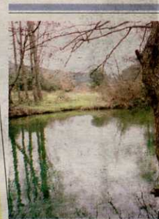
Vista del Ega.

NAVARRA. El Gobierno foral conmemorará hoy en Madrid el Centenario del Nacimiento de Hilarión Eslava con un concierto para órgano y tenor que se celebrará en la Real Iglesia de San Ginés, lugar con el que el compositor navarro mantuvo estrechos vínculos.