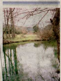
Vista del Ega.