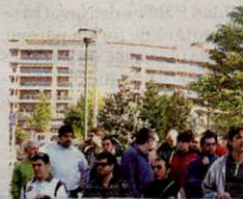
Los trabajadores, ayer.